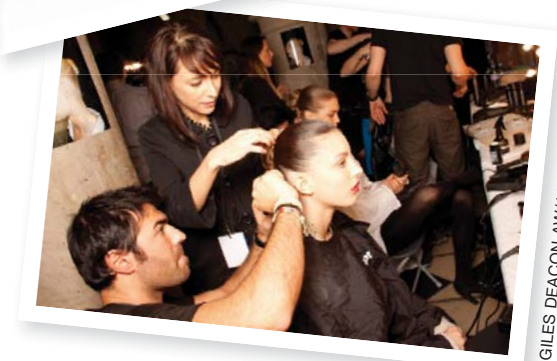
GILES DEACON AW/11