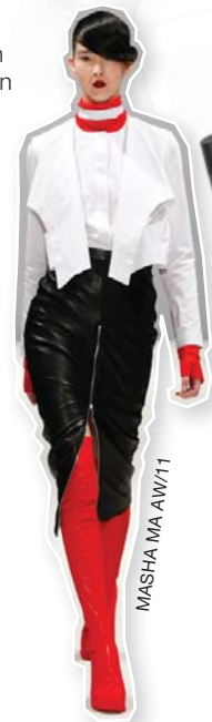
MASHA MA AW/11